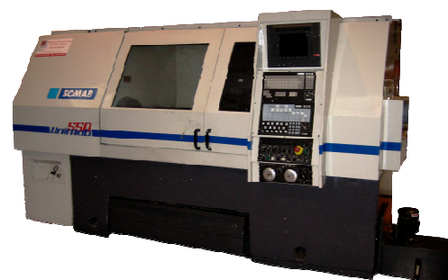
Tour à commande numérique