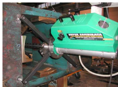
Alésage sur site